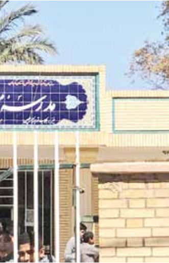
مدرسه ساخته شده توسط آژانس های گردشگری ژاپن در بم پس از زلزله

برای مثال اگر اشتباه نکنم در سال ۲۰۱۱ با مشکلی برخورد کردیم؛ متأسفانه با گروه‌نگاری یک شخص ژاپنی در شهر بم کرمان، سبب شد سطح هشدار کشور ژاپن برای سفر شهروندانش به استان کرمان به سطح ۲ برسد. معنی هشدار در این سطح، این بود که آژانس‌های ژاپنی امکان برگزاری تور از استان کرمان را نداشتند اما با سمت مسئولان و بخش‌های مختلف استان و همچنین ما که نقش کوچکی در این امر داشتیم و سفارت ژاپن در ایران و... مشکل حل شد. یک فم تریپ (سفری) برای معرفی یک مقصد گردشگری) برگزار کردیم. البته «هواپیمایی ترکیه» هم نقش مؤثری داشت و پرواز مجانی از ژاپن به ایران در اختیار ما قرار داد. ما تعدادی از آژانس‌های ژاپنی را آوردیم، آن فم تریپ باعث شد تعداد بیشتری از گردشگران ژاپنی به کرمان بیایند.