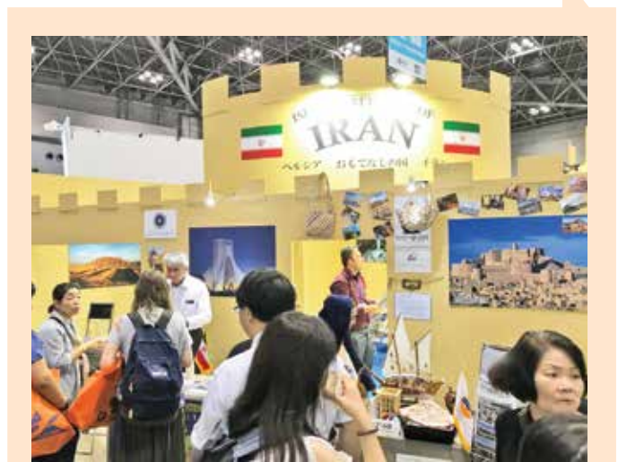
غرفه ایران در نمایشگاه گردشگری جاتا ۲۰۱۶ در بم

نئوتوانستید ترفطرا برای ژاپنی‌ها برگزار کنید؟